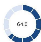
Figure - Dealing with Construction Permits in Tunisia - Score