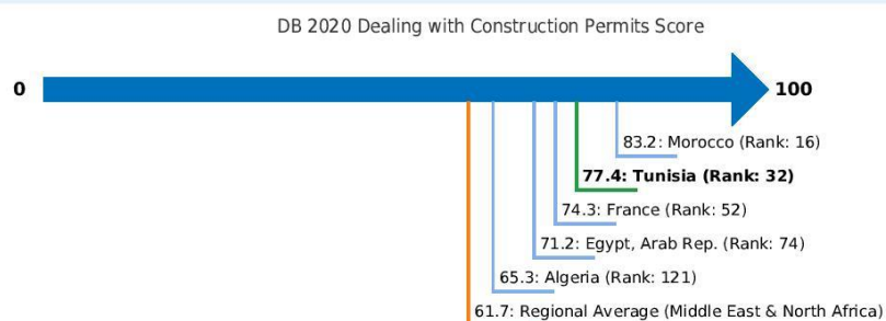
Figure - Dealing with Construction Permits in Tunisia and comparator economies - Ranking and Score

Note: The ranking of economies on the ease of dealing with construction permits is determined by sorting their scores for dealing with construction permits. These scores are the simple average of the scores for each of the component indicators.